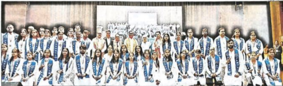
'SPECIAL' ACHIEVERS: The meritorious students of DSMNRU gather for a group photograph at the convocation event on Friday

"Specially abled students should not be in the same merit/medal list. They should have a distinct awards and medals list to be conferred during the convocation ceremony," said the governor while addressing students and teachers during the DSMNRU convocation ceremony.