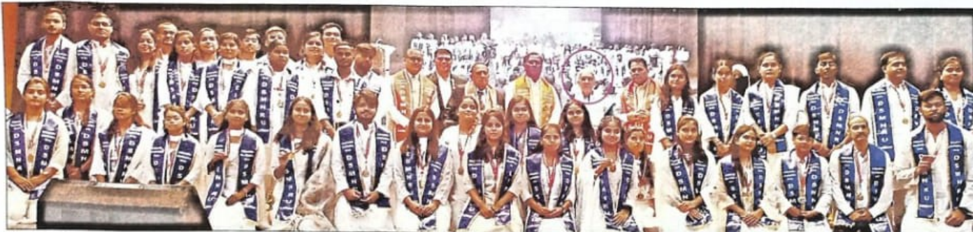
डॉ. शकुन्तला मिश्रा राष्ट्रीय पुनर्वास विश्वविद्यालय के दीक्षांत समारोह में मौजूद राज्यपाल आनंदी बेन पटेल ( लाल घेरे में), मुख्य अतिथि पद्म श्री मुरलीकांत राजाराम पेटकर व पदक प्राप्त करने वाले मेधावी ।