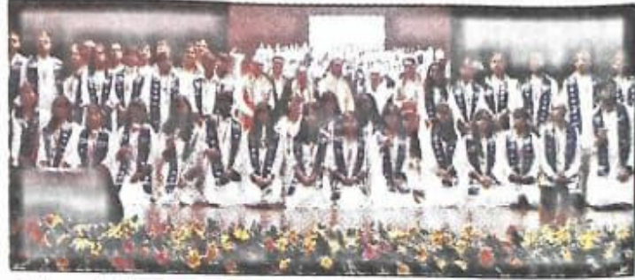
दीक्षांत समारोह में राज्यपाल आनंदीबेन पटेल व अन्य अतिथियों के साथ उपाधि व पदक लिए छात्र।

दीक्षांत समारोह की शुरुआत प्रदेश की राज्यपाल व कुलाध्यक्ष व मुख्य अतिथि पदमश्री विजेता मुरलीकांत राजाराम पेटकर ने दीप प्रज्ज्वलन कर