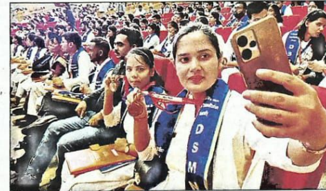
मेडल पाकर छात्रों के चेहरे खिल गए, उन्होंने सेल्फी भी ली।