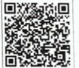
क्यूआर को स्कैन कर देखें साक्षात्कार।

घटना के बाद नीचे का अंग ब्रेकर हो गया, पर दिल में खेलने और कुछ करने का जन्म था। इसलिए जैसे ही कुछ ठीक हुआ तो खेलना शुरू किया। वर्ष 1972 के पैरा ओलंपिक में टेबल टेनिस के साथ ही तैराकी में भाग लिया। तैराकी में स्वर्ण पदक समेत चार पदक मिले। वर्ष 2018 में इस उपलब्धि के लिए पद्मश्री मिला तो तो लगा कि जीवन में कुछ किया है।