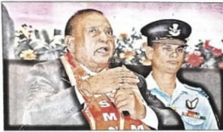
दीक्षांत समारोह में बोले मुख्य अतिथि पद्म श्री मुरलीकांत राजाराम पेटकर ।

राज्यपाल ने देश की प्रगति एवं विकास में दिव्यांगजनों की भूमिका को महत्वपूर्ण बताते हुए कहा कि भारत आज पैरा स्पेक्ट्रस के क्षेत्र में किसी भी परिचय का मोहताज नहीं है। राज्यपाल की अध्यक्षता में आयोजित समारोह में विद्यार्थियों को 1615 उपाधियां और 159 पदक प्रदान किए गए, जिसमें से 59 स्वर्ण पदक, 50 रजत पदक एवं 50 कांस्य पदक शामिल थे। एमटैक कंप्यूटर साईंस एंड इंजीनियरिंग विट आर्टिफिशियल इंटेलिजेंस एंड मशीन लर्निंग के