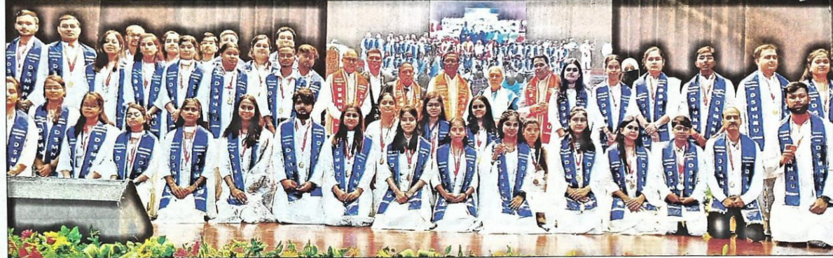
पुनर्वास विश्वविद्यालय के दीक्षांत समारोह में शुक्रवार को 130 मेधावियों को मेडल दिए गए, इसके साथ 36 शोधार्थियों को पीएचडी की उपाधि दी गई।

समारोह में राज्यपाल आनंदीबेन पटेल ने कहा कि विवि में पहले डिग्री मार्कशीट से लेकर ऐडमिशन तक का काम आईटी कंपनियाँ करती थीं, जिस पर सालाना 200 करोड़ रुपये खर्च होते थे। हमने यह सब बंद कर अब सब मुफ्त कर दिया है। समर्थ पोर्टल के जरिए ये काम आसानी से हो रहे हैं। डिजिलॉकर में तुरंत डिग्री जा रही है। शकुंतला विवि में अभी मार्कशीट ऑनलाइन नहीं है। ऐसे में डिग्री के साथ मार्कशीट भी ऑनलाइन अपलोड की जाएगी। वर्तमान सत्र के साथ विवि से आज तक जितने छात्र पासआउट हुए हैं, उन सब की डिग्री मार्कशीट ऑनलाइन की जाएगी। उन्होंने विवि का पूरा ब्योरा दो महीने में समर्थ पोर्टल पर अपलोड करने को कहा। इसके अलावा नैक व एनआईआरएफ रैंकिंग और प्रोडिंग का काम भी दोबारा शुरू करवाने को कहा।