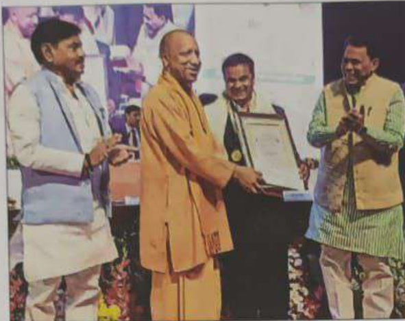
CM Yogi during an event marking the Int'l Day of Persons with Disabilities at Lok Bhavan in Lucknow on Tuesday.

"Colleges are also being run for visually impaired, deaf and dumb and other children in different areas, but there is a need