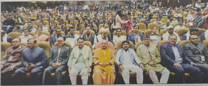
लोकभवन में दिव्यांगजन सशक्तीकरण विभाग की ओर से आयोजित राज्य स्तरीय पुरस्कार वितरण समारोह में सम्मानित लोगों व छात्र-छात्राओं के साथ सीएम योगी आदित्यनाथ, विभाग के मंत्री नरेंद्र कश्यप व अन्य।

तीन हजार रुपये महीना कुष्टावस्था पेंशन पीड़ित व्यक्ति के परिवार को उपलब्ध कराते हैं। इन परिवारों को पीएम या सीएम आवास भी देंगे।