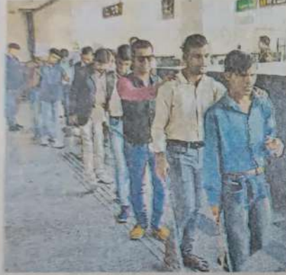
शकुंतला विश्वविद्यालय के छात्रों ने सिंगार नगर से गंज तक मेट्रो की यात्रा की • विश्वविद्यालय

कृत्रिम अंग एवं पुनर्वास केंद्र के सभागार में हुई संगोष्ठी में मुंबई की